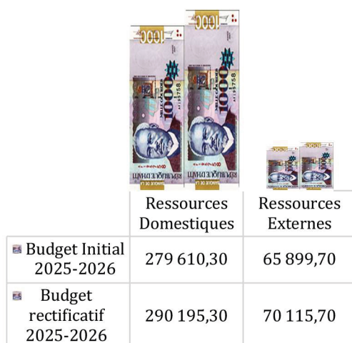
Dépenses du budget rectificatif 2025-2026 comparées à celles du budget initial 2025-2026